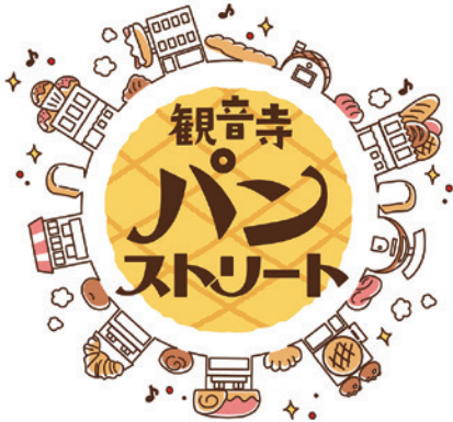
観音寺パンストリートのロゴマークと過去の様子

今回は25店舗のパン屋さんが出店予定ですので、皆様のお越しを心よりお待ちしております。