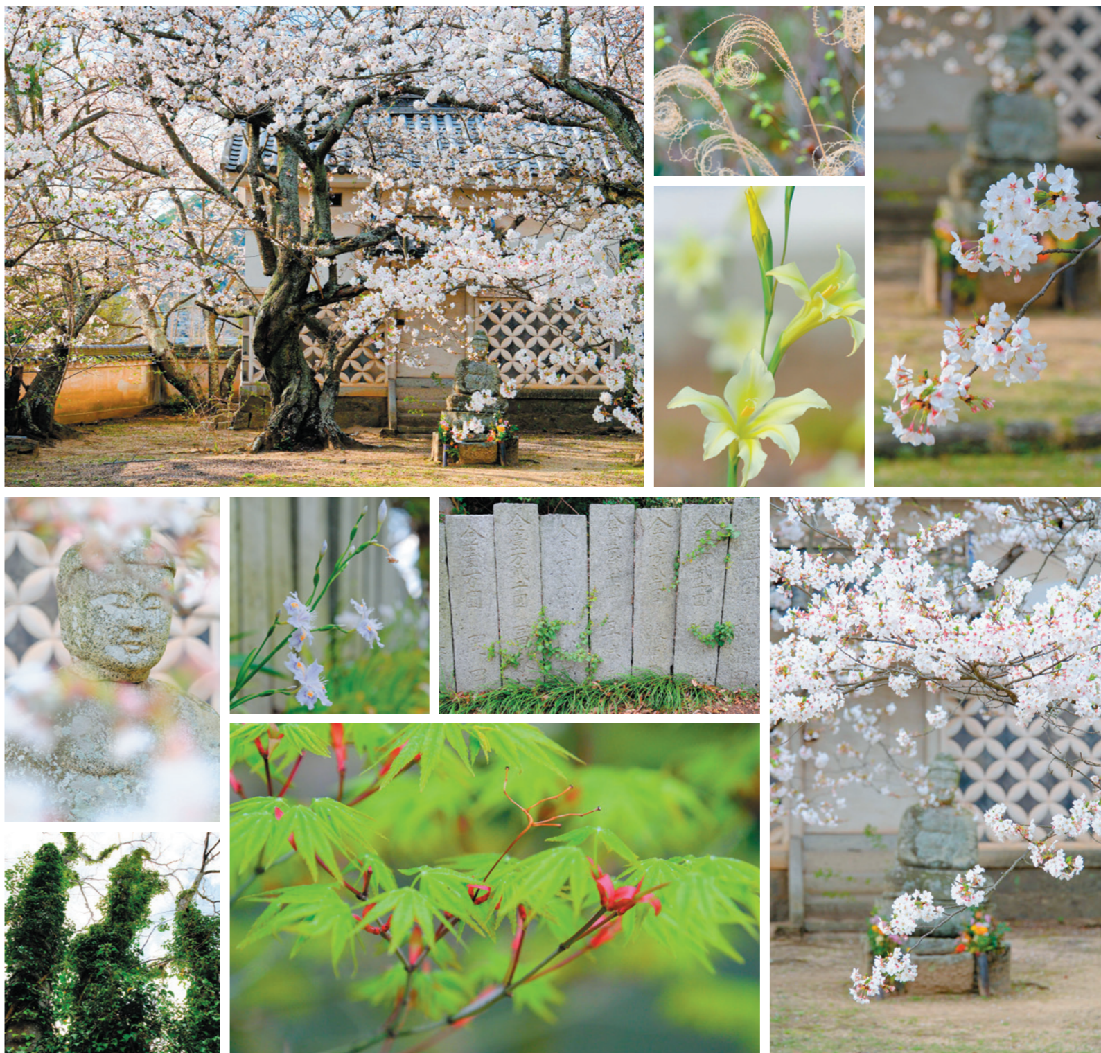
タイトル：宝珠寺の春風景 お地藏さんと桜がよく似合う境内。今年も定期的に桜が咲き誇りました!